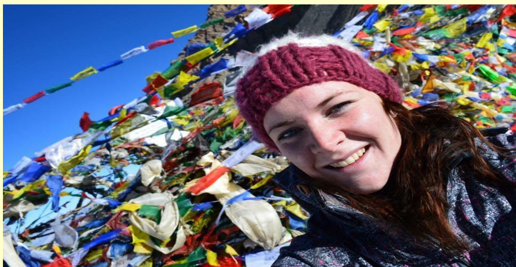
Op 25 november he